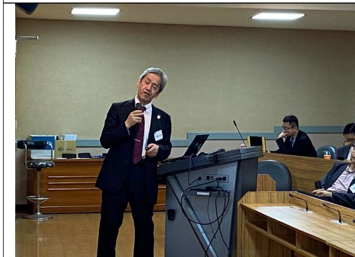
【邀請演講 I】京都大學/大嶋 正裕教授