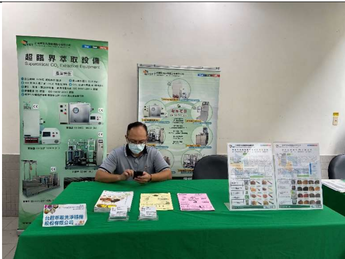
贊助廠商展位：台超萃取洗淨精機(股)公司