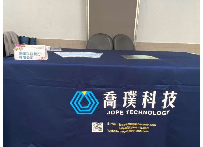
贊助廠商展位：喬璞科技(股)公司