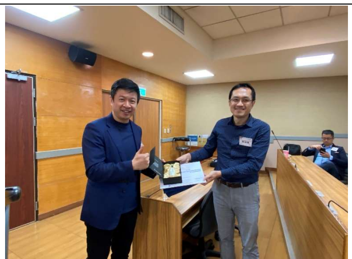
頒贈邀請講者感謝狀及禮品