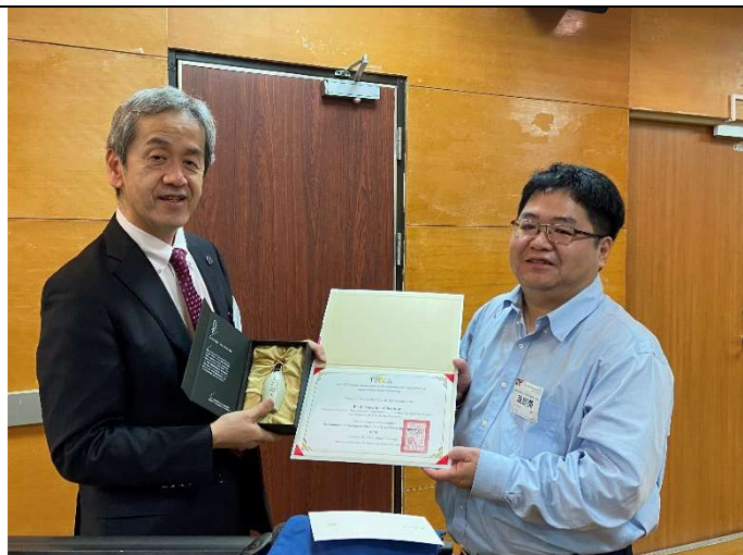
頒贈邀請講者感謝狀及禮品