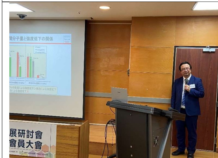
【邀請演講 II】金澤大學/瀧 健太郎教授