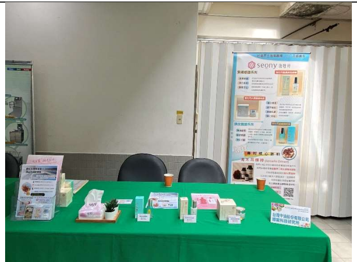
贊助廠商展位：中油(股)公司綠能科技研究所