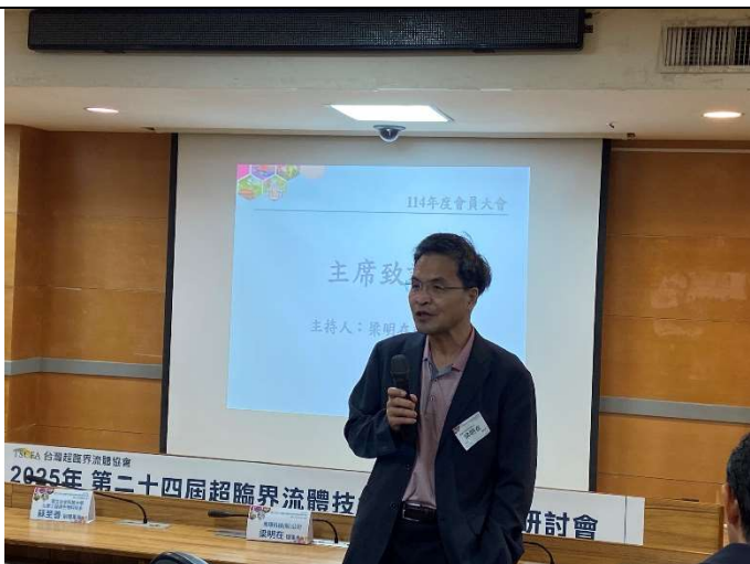
第 11 屆第 2 次會員大會：理事長致詞