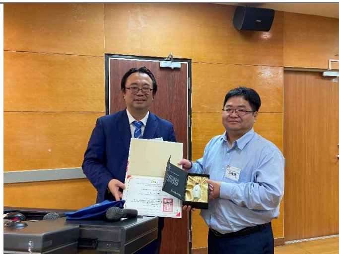
頒贈邀請講者感謝狀及禮品